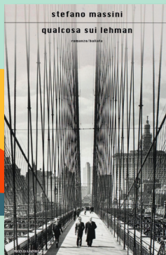
Stefano Massini Qualcosa sui Lehman MONDADORI