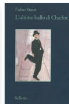
Fabio Stassi L'ultimo ballo di Charlot Sellerio