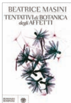
Beatrice Masini Tentativi di botanica degli affetti Bompiani